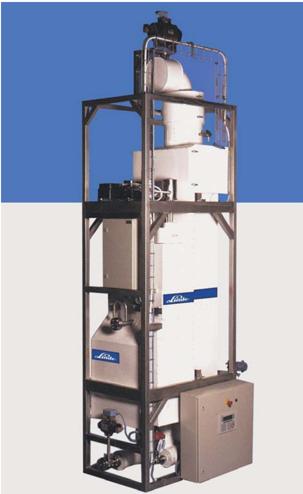
CIRRUS M 150

El soporte sobre el que van montados, es de acero inoxidable AISI 304. Los condensadores están aislados con espuma de poliuretano y armaflex aluminizado. El material aislante no contiene CFCs.