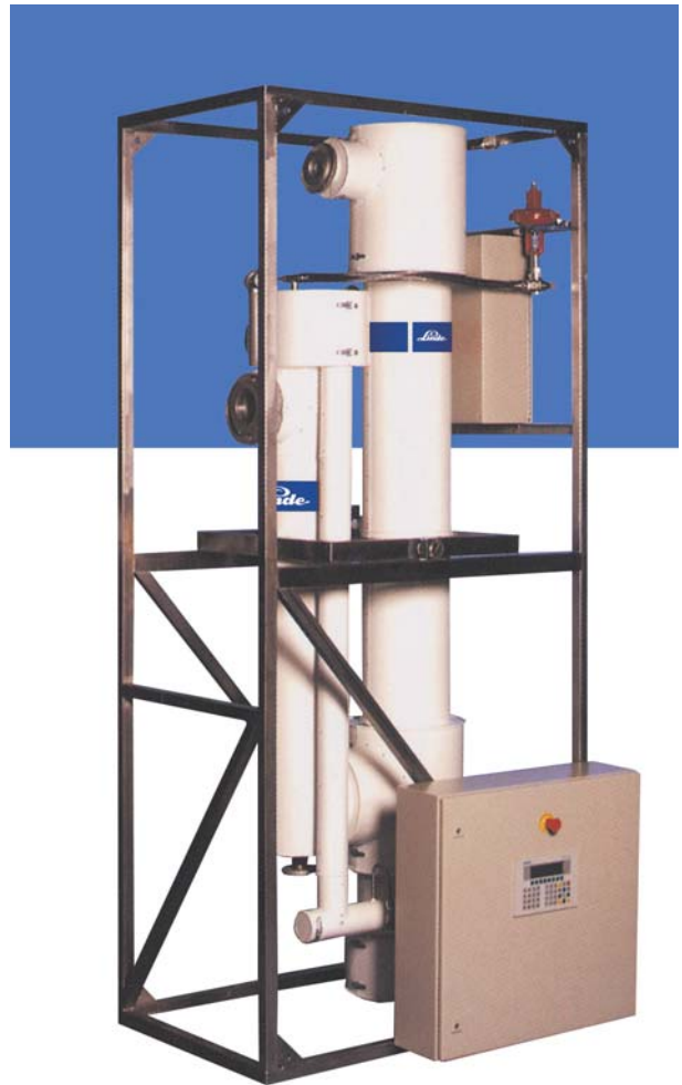
CIRRUS M 50

Linde, a través de su filosofía orientada al servicio y a la solución de problemas, pone a su completa disposición su know-how y los recursos necesarios para realizar un análisis exhaustivo