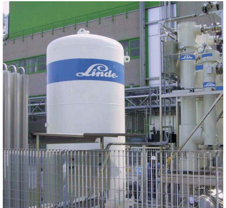
CIRRUS® Vec M50

De hecho, como el nitrógeno líquido es el medio refrigerante a -196\text{ °C} y la temperatura de solidificación de los disolventes que queremos